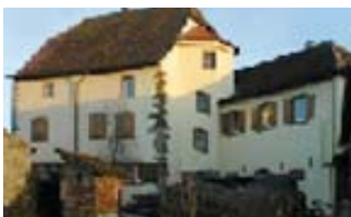
Die ehemalige Burg Steiſerhof aus dem 12./13. Jahrhundert.