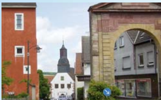
Das obere Stadttor und das Rathaus aus dem 18. Jahrhundert.