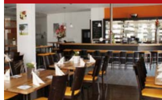
Restaurant Capito - genießen Sie die mediterrane Küche.

Auch für das leibliche Wohl unserer Gäste ist gesorgt!