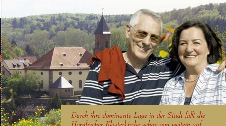
Durch ihre dominante Lage in der Stadt fällt die Hornbacher Klosterkirche schon von weitem auf.

Am Südwestrand des Pfälzer Waldes, im idyllischen Hornbachtal gelegen ist Hornbach, auch Ausgangspunkt für Wanderer und Pilger. Die nördliche und südliche Route des pfälzischen Jakobspilgerweges, der in Speyer beginnt, enden im Kloster Hornbach.