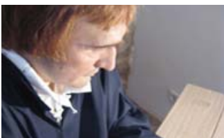
Hieronymus Bock - neben Pirminius der berühmteste Sohn der Stadt.