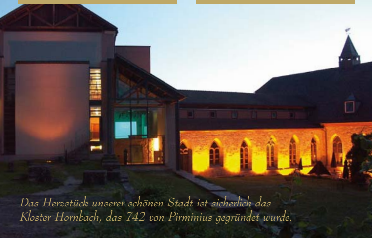
Das Herzstück unserer schönen Stadt ist sicherlich das Kloster Hornbach, das 742 von Pirminius gegründet wurde.