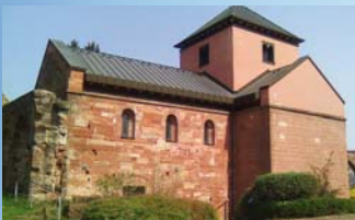
Die Stiftskirche St. Fabian existierte schon seit Ende des 10. Jahrhunderts.