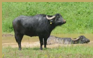
Wasserbüffel beweiden ein Areal im Hornbachtal.